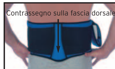
Fig. 5 Fascia dorsale BAXOLVE™