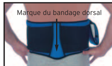
III. 5 : bandage dorsal BAXOLVE™